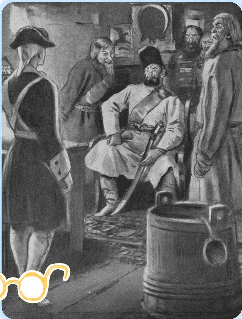
Иллюстрация к роману А. С. Пушкина «Капитанская дочка», худ. Герасимов С. В.