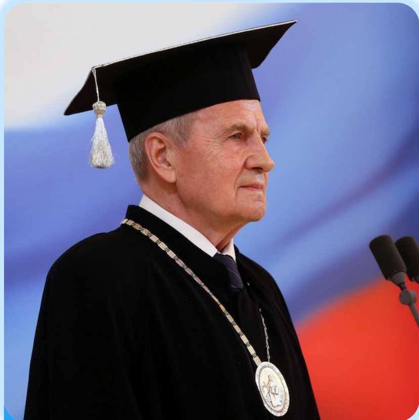
Председатель Конституционного Суда Валерий Зорькин

■ судьи обязаны осуществлять правосудие в мантии